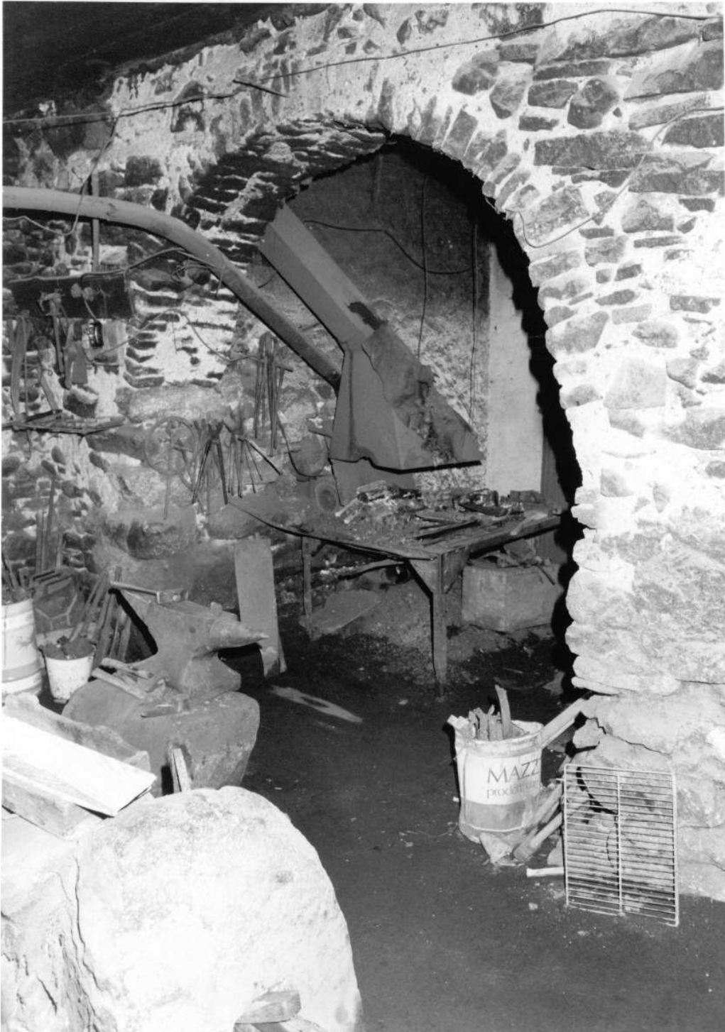
1. Scorcio con incudine e forgia: da notare, dietro la cappa, il tubo che incanalava l'aria per ravvivare la fiamma

Raccolta fotografica - Foto di Paolo De Gasperi - Fucina dei fratelli Grisenti (Baselga di Pinè) e più moderna Fucina del fabbro Felice Vanzo (Daiano)