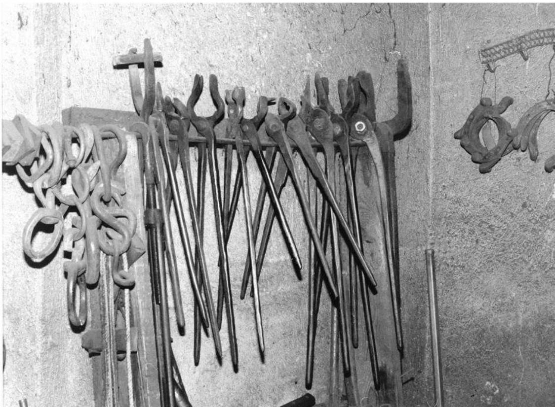
9. Particolare di tenaglie.