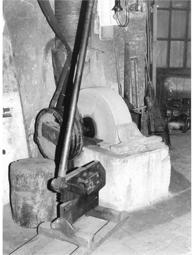
3. Particolare della trancia e della mola in pietra arenaria.