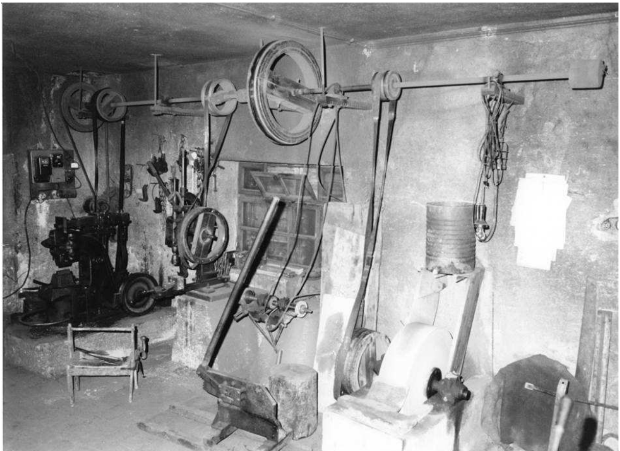
7. Lato nord fucina Vanzo: in serie, da sinistra verso destra: il maglio, il trapano, la trancia, la mola. Il funzionamento a pulegge è lo stesso, solo che ora è azionato dalla corrente elettrica anziché dall'acqua.