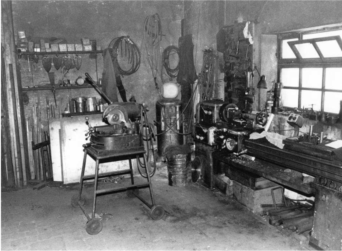
8. Lato est: al centro della foto una sega; addossato alla parete, sotto la finestra, il tornio.