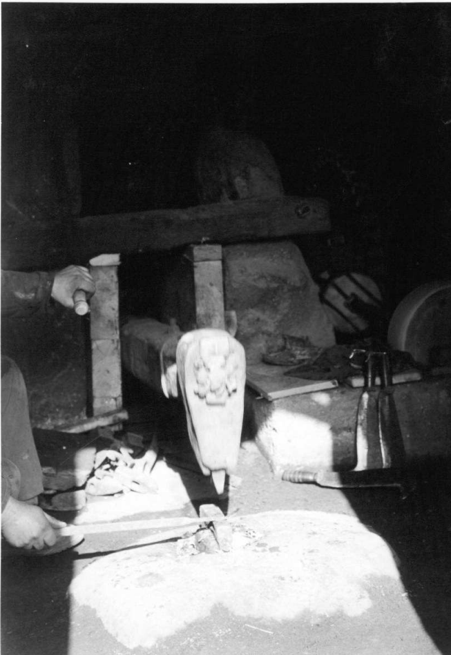
4. Particolare del maglio, preso di fronte e del piano di battuta (batidór).