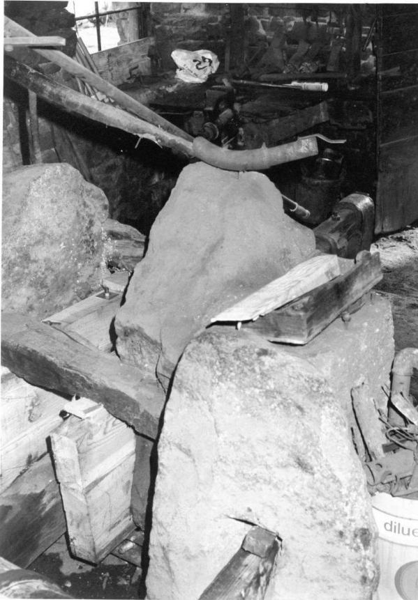
2. Appoggiata sul sasso, al centro della foto, è visibile l'asta che manovra la saracinesca del canale esterno.