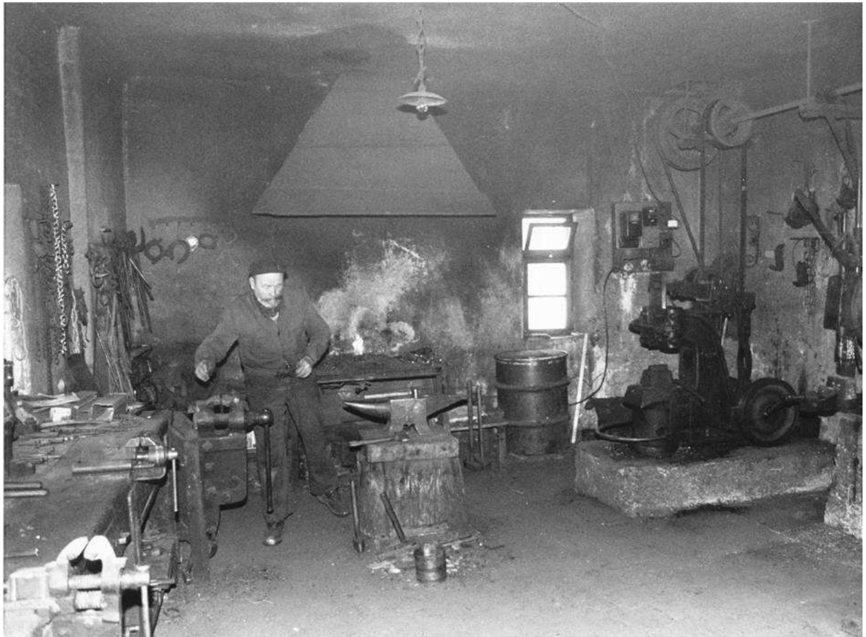
6. Lato ovest fucina Vanzo: visibili, da sinistra verso destra, il bancone con le morse, la forgia con sopra la cappa, l'incudine, il bidone (un tempo era in legno) per l'acqua e il maglio (ora elettrico).